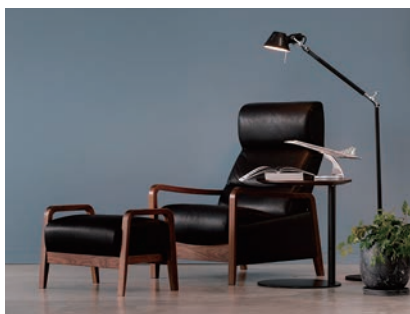
マルイチセーリング